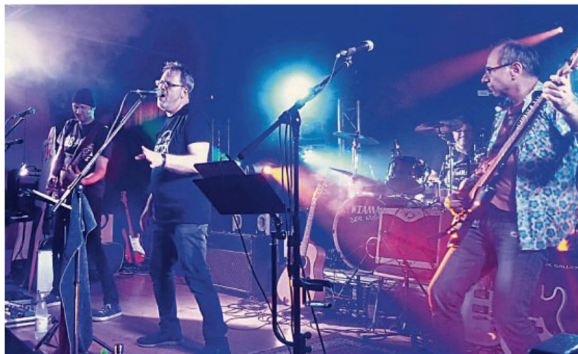
Mit bekannten Rocksongs aus fünf Jahrzehnten sorgte „Oldschool Rock“ für Stimmung.

Am Samstag, 8. Februar, wird „Tasted“ im LÖF Eventlokal Remscheid und am Samstag, 7. März, im Platz 16 spielen. „Oldschool Rock“ wird als nächstes am Donnerstag, 19. März, in der Alten Drahtzieherei zu hören sein.